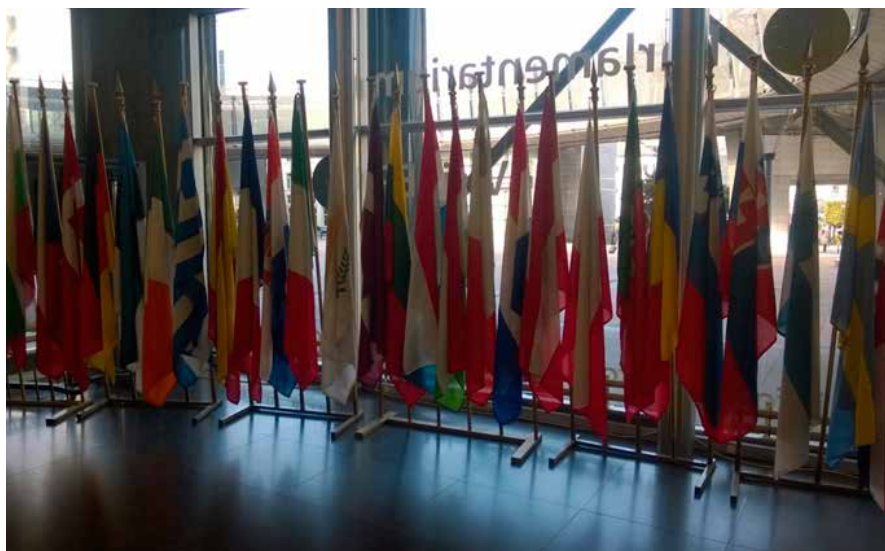
Entrén till Parlamentarium

Om du är intresserad att veta mer är du välkommen att kontakta personerna som var med på resan. Du ser deras kontaktuppgifter sist i dokumentationen!