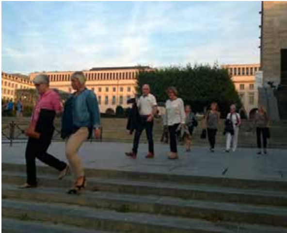
Småprat på väg mot middagen!