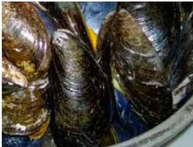
Moules frites – Belgiens nationalrätt!