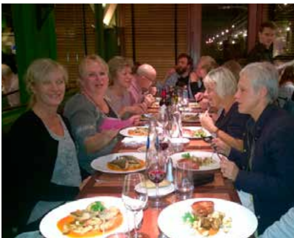
Avskedsmiddag i de mysiga konstnärskvarteren i stadsdelen Châtelain.