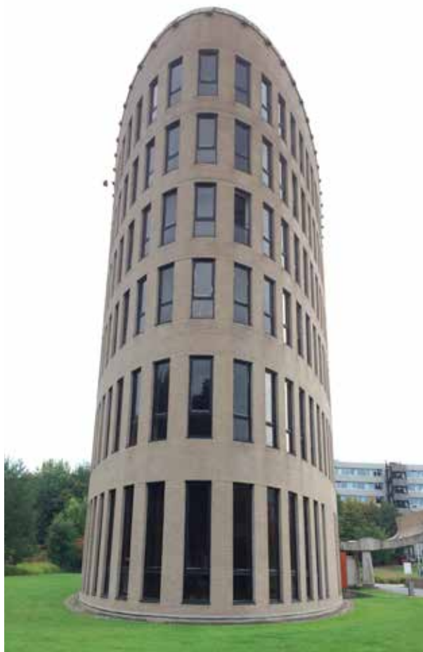
Vrije Universiteit. En av universitetets speciella byggnader - väldigt smal men också oväntat lång!