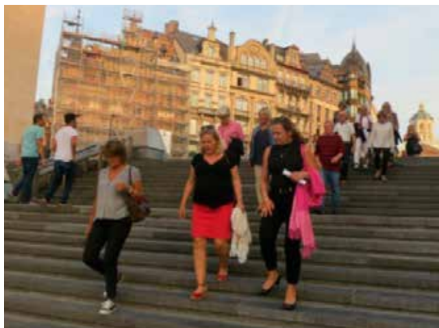
Unilink-gänget på väg mot middagen!